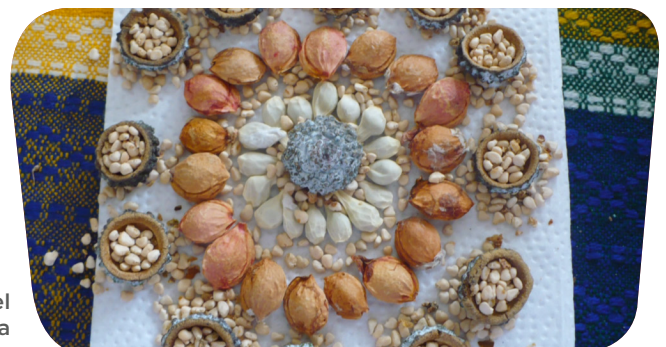
Imagen de mandala creada por el artista plástico Alberto Lozada

“Mayaya O” es una pieza musical que hace parte de los rituales de agradecimiento a la tierra y la naturaleza. Invita a recorrer en compañía de padres, madres y familiares que se convertirán en árboles, cuevas y diferentes elementos de este lugar.